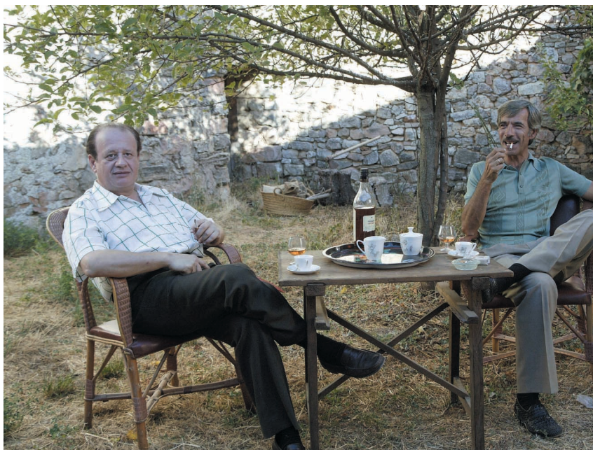
Miguel -Juan Echanove- vuelve en la octava temporada.

Desde el punto de vista político hay varios acontecimientos que repercutirán en la vida de los Alcántara y de los demás vecinos del barrio. Uno de ellos fue la revolución de los claveles en Portugal, por la que un grupo de militares, con el General Spínola al frente, finiquitó, casi sin derramamiento de sangre, el régimen autoritario más longevo del mundo occidental: el conocido como Estado Novo del dictador Salazar, instalado en Portugal desde 1933. Esta sublevación militar, que contó con el apoyo mayoritario y entusiasta de la población civil, tuvo gran impacto en la sociedad española, especialmente en los