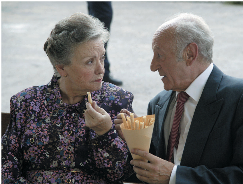
Herminia continúa viéndose con su “amigo”

España está cambiando y esto se nota en política... y en otros aspectos de la sociedad. La censura se relaja gracias a Pío Cabanillas, Ministro de Información y Turismo, y 1974 se convierte en el año del “destape”. Crece el interés por el sexo en una sociedad acostumbrada a la represión y al paternalismo del régimen franquista. Aunque la censura se suaviza, para ver películas eróticas los españoles tenían que irse al extranjero y eso harán algunos de los vecinos de San Genaro.