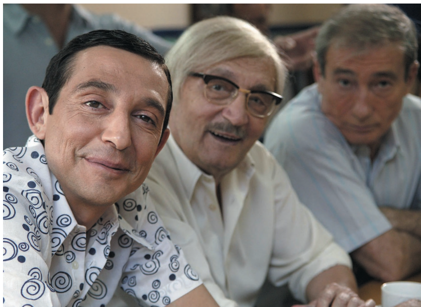
Los protagonistas de "Cuéntame" afrontarán años convulsos, de incertidumbre e ilusión por el futuro de España.

Pero estos tímidos intentos encontraron una fuerte oposición en los círculos más inmovilistas del régimen y en figuras como el ultraderechista Blas Piñar o Antonio Girón, ex ministro de los primeros gobiernos de Franco, que, en un artículo publicado en el diario Arriba, criticó duramente el "Espíritu del doce de febrero". Fue el llamado Gironazo, y en él reclamaba el verdadero y único espíritu del régimen, es decir, el del 18 de julio de 1936, día del alzamiento nacional.