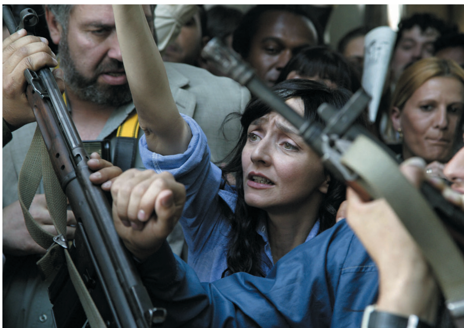
Se han reconstruido los escenarios que vieron nacer la revolución de Portugal .

Pero además, “Cuéntame cómo pasó” mantiene su identidad a través de una estética propia donde la calidad de la imagen juega un papel fundamental. En esta temporada la serie ha apostado por la grabación en HD (Alta Definición) con el objetivo marcado desde sus comienzos de lograr un producto bien realizado, con una imagen de alta calidad técnica.