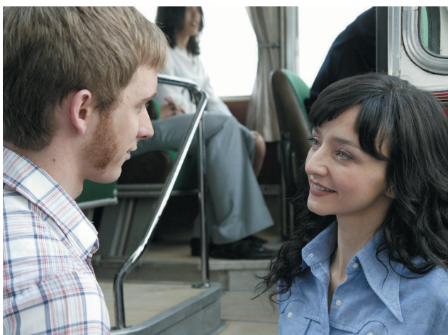
La actriz portuguesa María de Medeiros encarna a Carmen, una fotógrafa que vive la "Revolución de los claveles" junto a Toni.

eso, miles de españoles viajaron hasta Portugal para vivir de cerca este atípico levantamiento que devolvió la democracia al país vecino.