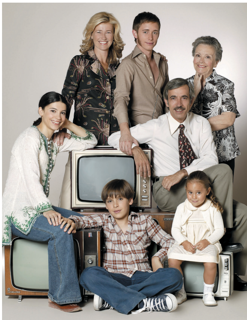
La nueva temporada se ambienta en 1974 y concluye el invierno de 1975.

El año comenzó con la resaca del atentado, a finales de 1973, que acabó con la vida del Almirante Luis Carrero Blanco, primer presidente del gobierno de la dictadura además del propio Franco. Contra todos los pronósticos, el Caudillo