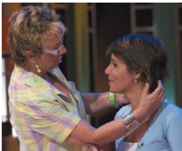
España Directo ofrecerá cada día una fotografía de la realidad cotidiana de España.

La inmediatez –los periodistas estarán cada día en el lugar de la noticia–, la pluralidad –responden a los distintos acentos de la geografía española– y un estilo propio se convertirán pronto en sus principales señas de identidad. Porque los reporteros de “España Directo” son los “embajadores” de los telespectadores, con licencia para preguntarlo todo y curiosearlo todo. Con naturalidad, sin estridencias. Observan las