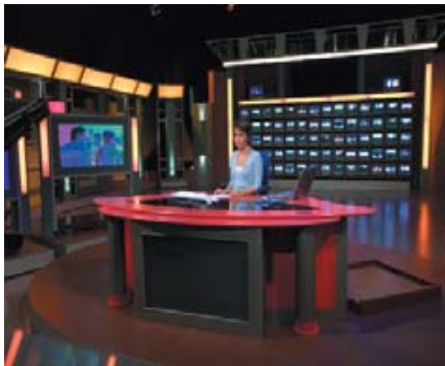
España directo se emite desde los estudios de TVE en Prado del Rey.

Las fiestas de cada comunidad, los sucesos, los actos sociales, los principales acontecimientos deportivos y las actividades culturales de interés nacional tendrán cabida en este nuevo programa, hecho en directo desde los estudios de TVE en Prado del Rey, en Madrid, y en el que los Centros Territoriales de TVE