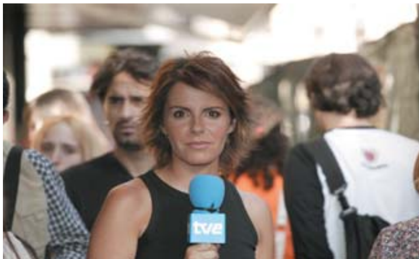
La calle será protagonista del nuevo magazine de La Primera.

En la actualidad formaba parte del equipo de reporteros del área de sociedad de los Informativos de TVE, donde ha cubierto algunas de las noticias más destacadas de este último año, como el tsunami que asoló el sudeste asiático o la muerte del Papa Juan Pablo II.